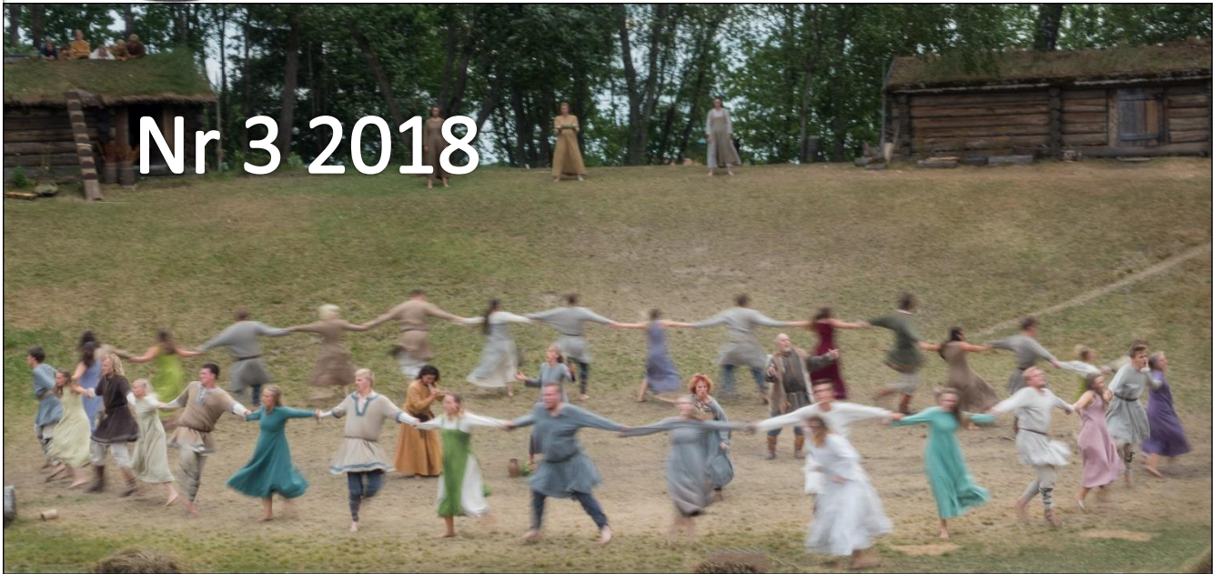
«Spelet», foto og redigering Niklas Angelus